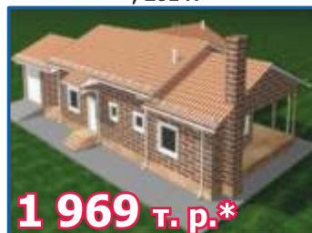
Одноэтажный жилой дом с гаражом «ВАБАСК VIP», 201 м 2