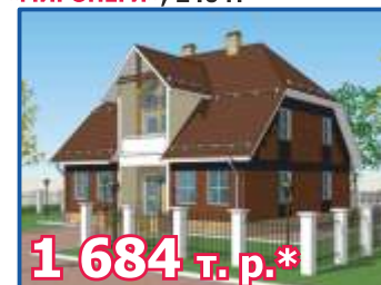
Одноэтажный жилой дом с мансардой «МИРОНЕГИ», 240 м 2