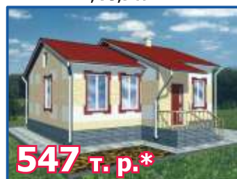
Одноэтажный жилой дом «САХАЛИН», 79,7 м 2