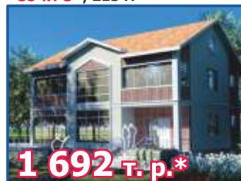
Двухэтажный жилой дом «СОЧИ-3», 213 м 2