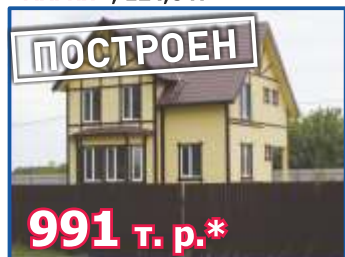
Двухэтажный жилой дом «МАРИЯ», 124,6 м 2

г. Чебоксары, Кабельный проезд, 4 (8352) 22-08-08, 30-80-55