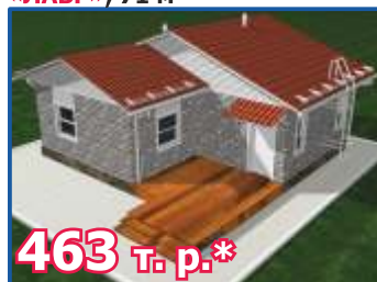
Одноэтажный жилой дом «ЛАВР», 71 м 2