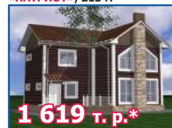
Двухэтажный жилой дом «ПАТРИОТ», 213 м 2