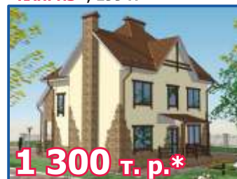
Двухэтажный жилой дом «КАПРИЗ», 199 м 2