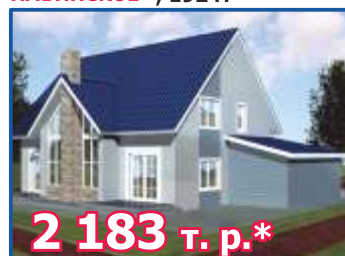
Двухэтажный жилой дом с гаражом «ИЛЬИНСКОЕ», 192 м 2